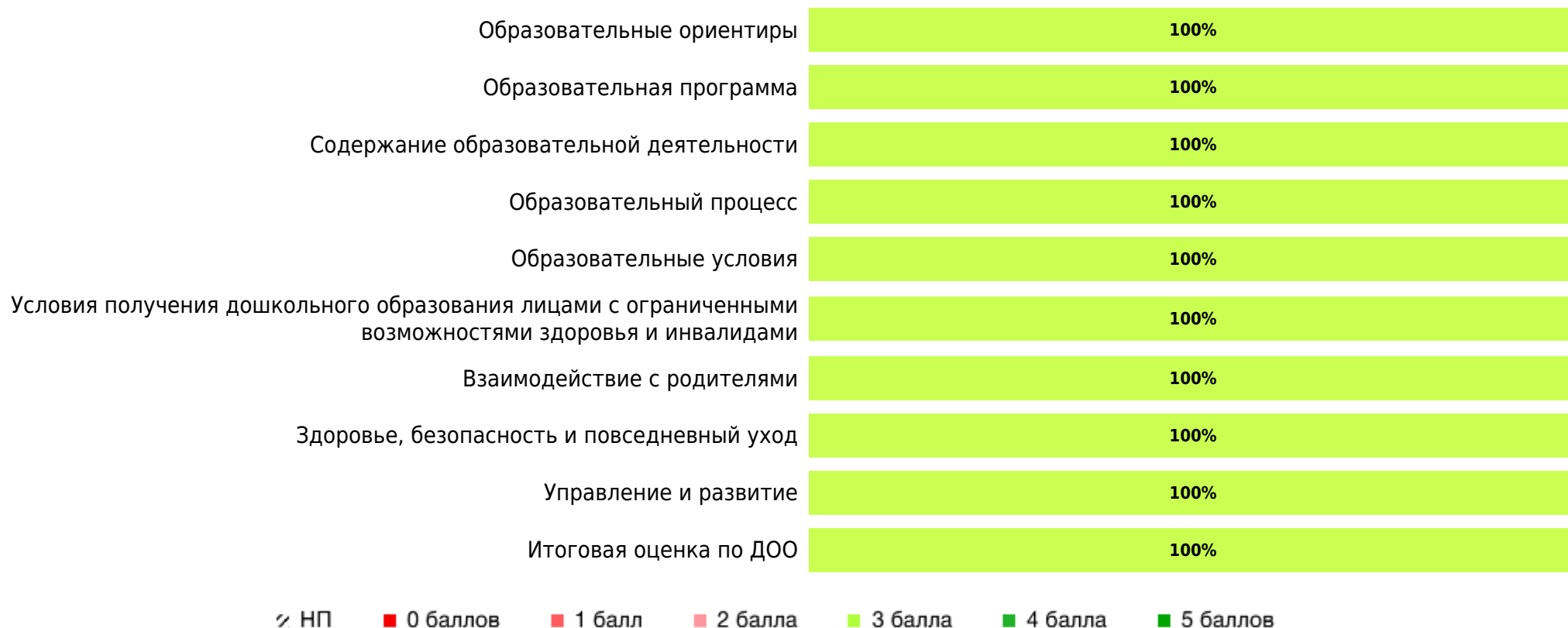
Доли ДОО с разными баллами у педагогов