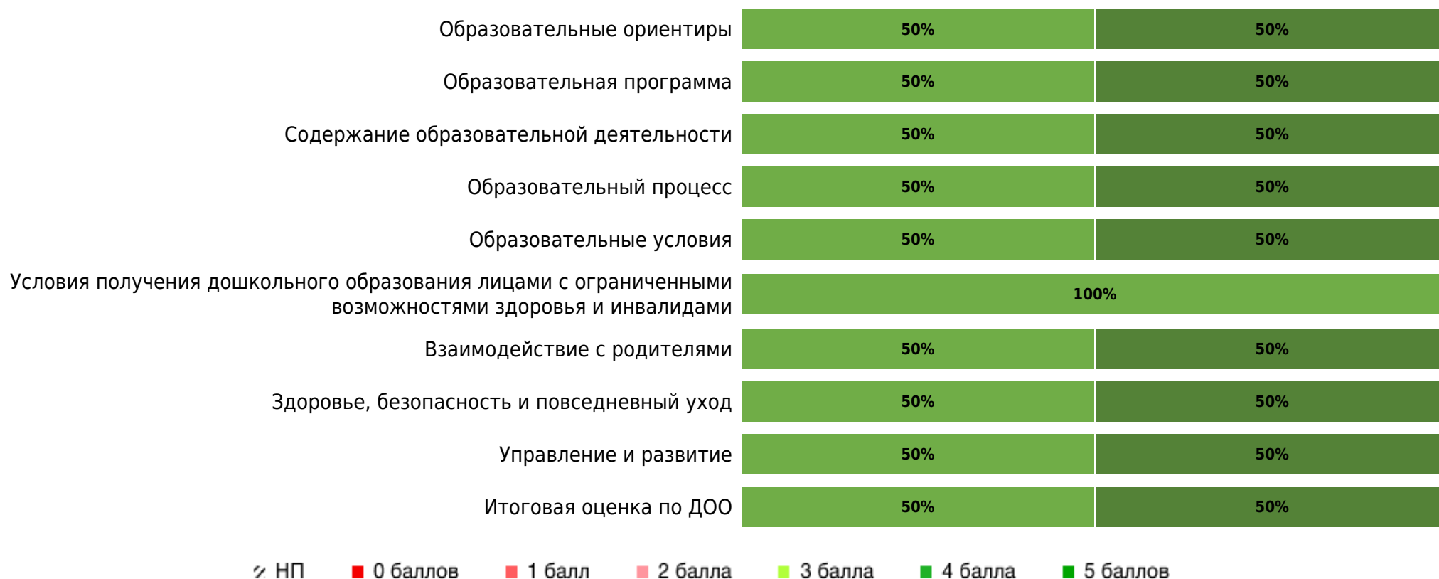
Доли ДОО с разными баллами (степень вовлеченности родителей)

Результаты оценки качества образования в ДОО субъекта РФ с точки зрения родителей/законных представителей (степень вовлеченности) по областям качества (по 5-балльной шкале):